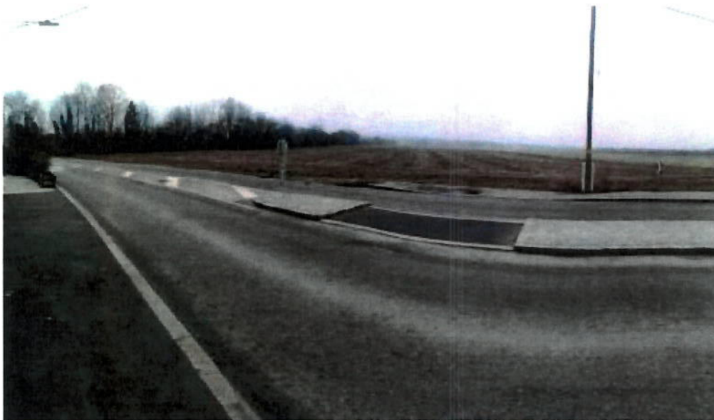
BezR KO Karl MAREDA

Der Fußgängerweg in der Strebersdorfer Straße endet nach der Ordnungsnummer 121 und wird auf der gegenüberliegenden Straßenseite, in Richtung Hasswellgasse, fortgeführt. In diesem Bereich gilt zwar eine Tempo 30 Beschränkung, jedoch befindet sich die Quermöglichkeit im Kurvenbereich. Um ein gefahrloses Queren der Fahrbahn zu ermöglichen, scheint diese Maßnahme dringend angebracht.